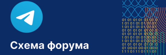
Схема форума и вся деловая программа под рукой в Telegram-боте